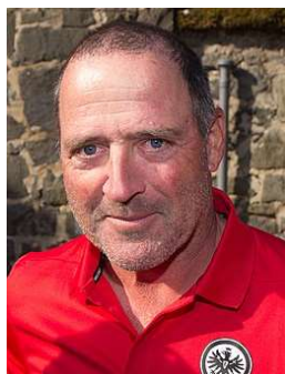
Ex-Fußballprofi Uwe Bein