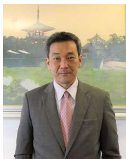
Generalkonsul Shinichi Asazuma