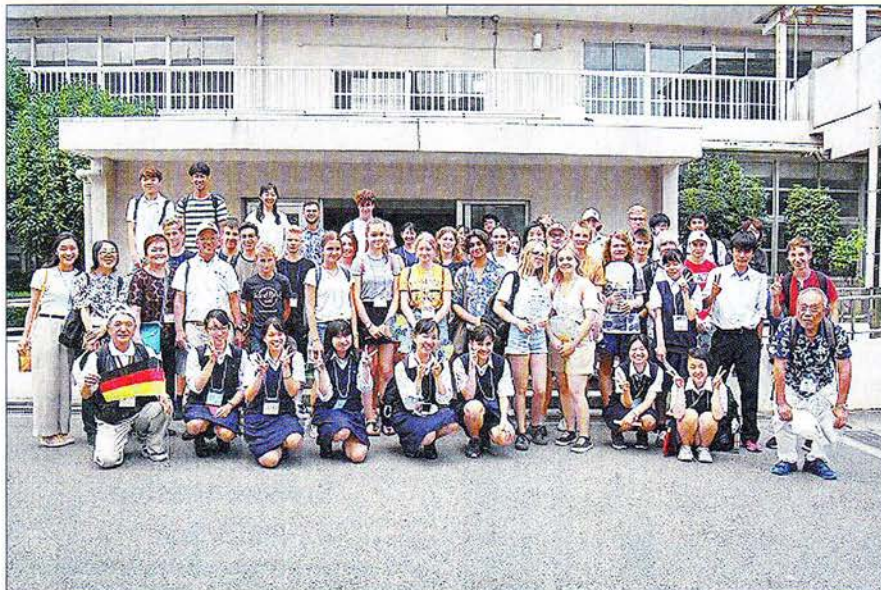
Auch ein Schulbesuch in Warabi gehörte zum Jugendprogramm

Mit der Sayonaraparty fand am Dienstag der zehntägige Aufenthalt in der japanischen Partnerstadt Warabi für 14 Jugendliche und ihre beiden Betreuer ihren Abschluß. Untergebracht in Gastfamilien war die Teilnahme am dreitägigen Jugendlager der Stadt Warabi in Otawara Fureai no Oka. An diesem nahmen insgesamt 60 Jugendliche aus Warabi, Linden, Katashina und Otawara sowie Lindens Partnerstadt Machern teil. Das Jugendlager diente dem Kulturaustausch, wobei morgens Radiogymnastik angesagt war. Besichtigt wurden unmittelbar nach dem Lager der Toshogu, ein berühmter Shinto-Schrein in Nikko wie auch am Sonntag die Hauptstadt Tokio.