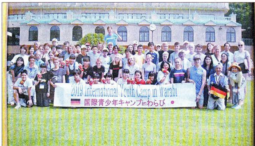
Jugendlager der Stadt Warabi in Otawara Fureai no Oka