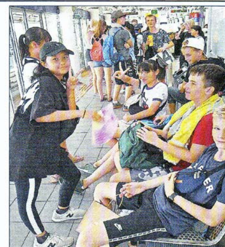
Tokio wurde besucht und dabei auch das eindrucksvolle U-Bahnnetz kennengelernt