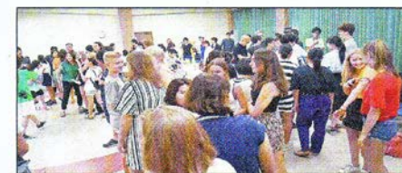
Am Dienstag fand der Aufenthalt mit der Sayonaraparty seinen Abschluß