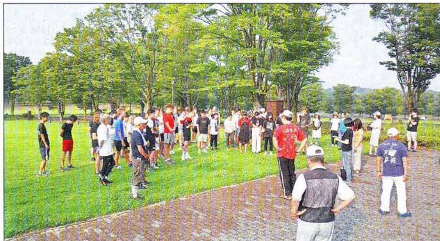
Radiogymnastik war täglich während des Jugendlagers bereits um 6.30 Uhr angesagt